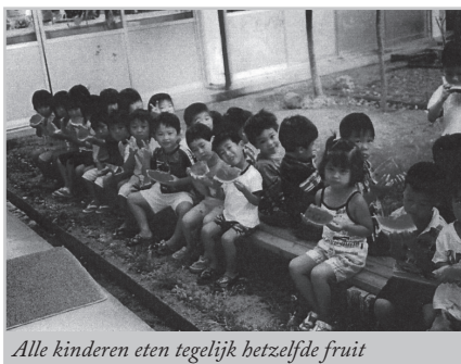
Alle kinderen eten tegelijk hetzelfde fruit

Het is niet eenvoudig om in een paar zinnen de Japanse cultuur te beschrijven, waar het onderwijs deel van uit maakt.